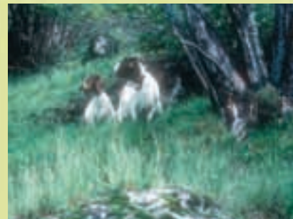
Chèvres Buren «Boer Bok» (6)