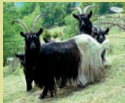
Chèvres à col noir (7)