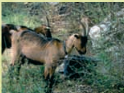
Chèvres bottées (4)

Dans la mesure du possible, favoriser une race rustique menacée de disparition répertoriée par la fondation «Pro Specie Rara». Dans ce cas, veiller à ne garder que les bêtes typiques pour assurer la sauvegarde de la race.