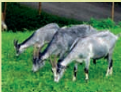
Chèvres grises des montagnes (5)