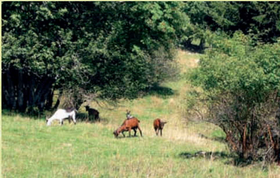
Pâturage par des chèvres pour lutter contre l'embuissonnement (1)

Les terrains peu productifs sont de moins en moins exploités. L'embuissonnement qui en découle évince les espèces typiques de ces surfaces. Cette fiche informe sur l'utilisation des chèvres pour préserver les prairies et pâturages secs (PPS).