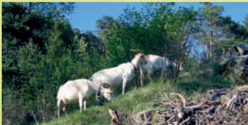
Scheidhalde, GR: pâture après débroussaillage (3)