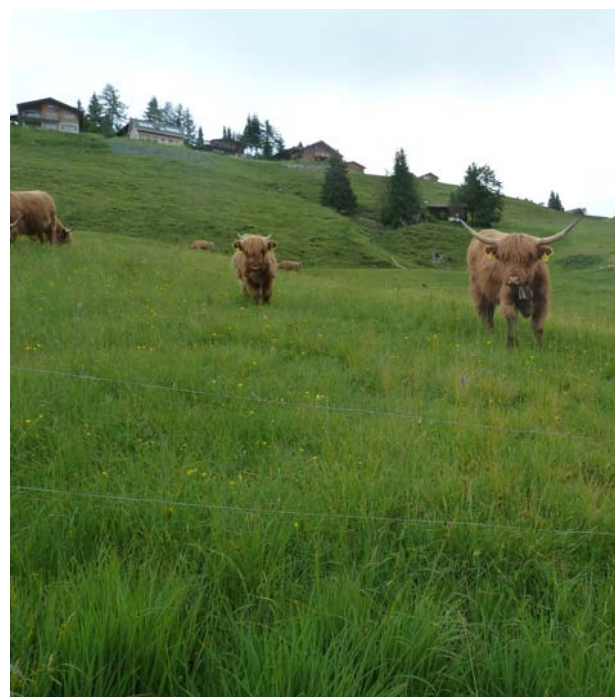
Bas-marais pâturé (LU)